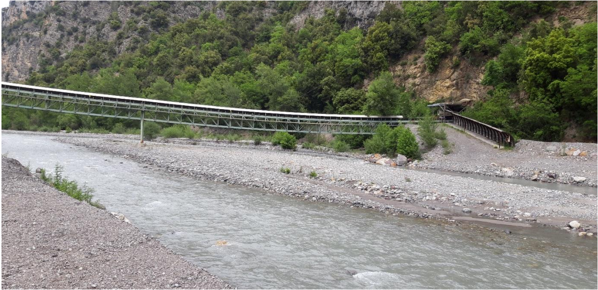
2 -Projet 2019 extension ouest