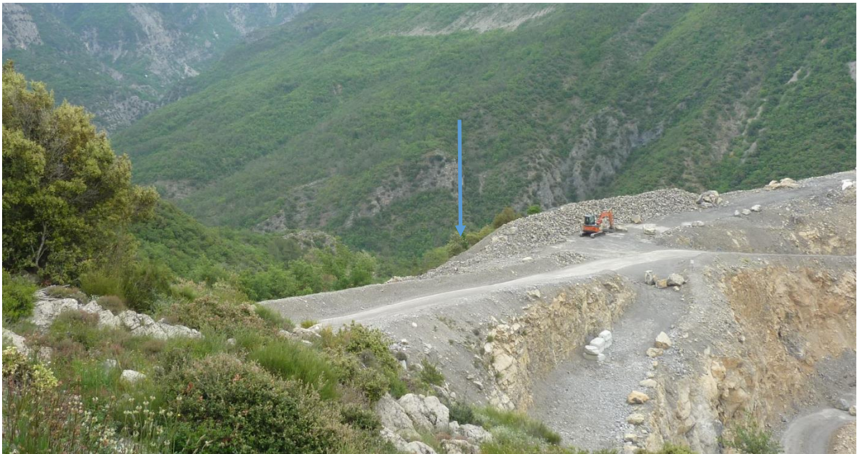
3 – Projet 2019 extension est